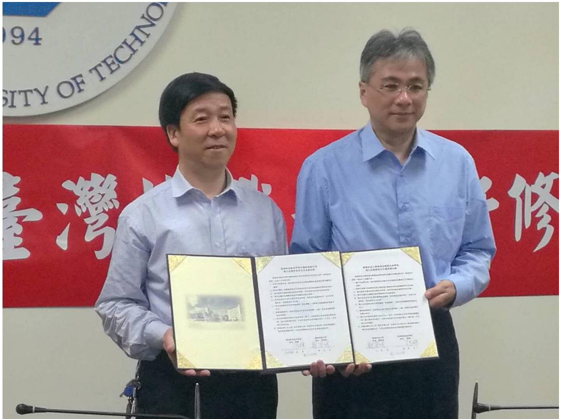
与朝阳科技大学签署《建立长期学术合作关系备忘录》